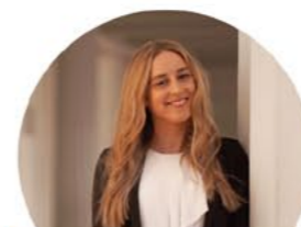
DANA WEGO Verkauf / Vermietung