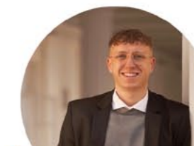
JAN HESS Vermietung