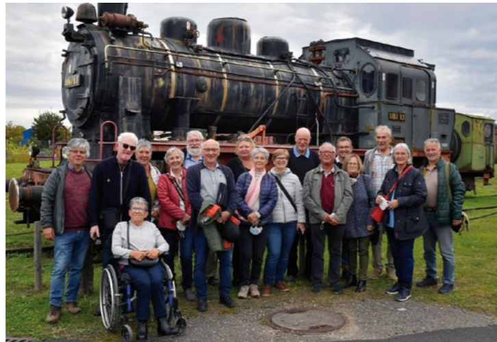
Mitglieder der Städtepartnerschaft beim Besuch im Alsdorfer Energeticon

Eigentlich wäre in Aachen im vergangenen Jahr ein großes Fest fällig gewesen. Die Städtepartnerschaft mit Montebourg in der Normandie, der ältesten Städtepartnerschaft Aachens, besteht seit 1960. Zum 60-jährigen Jubiläum wären nicht nur die französischen und deutschen Fahnen gehisst worden, es hätte ein tolles Fest werden sollen. Corona hat, wie bei so vielen anderen schönen Dingen des Lebens, leider einen Strich durch die Rechnung gemacht.